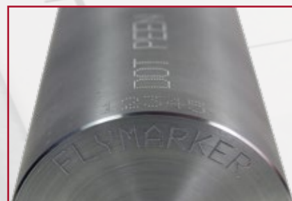
Značení válcových dílů