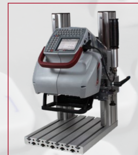
Stojan pro značení menších dílů (volitelné)