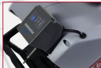
Integrovaná čtečka čárových kódů (volitelné)