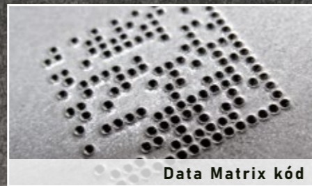
Data Matrix kód