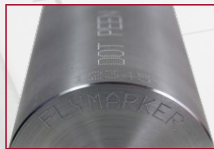
Značení válcových dílů