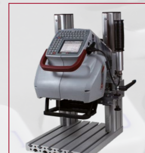
Stojan pro značení menších dílů (volitelné)