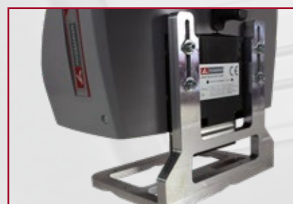
Odnímatelná opěrná příruba (volitelné)